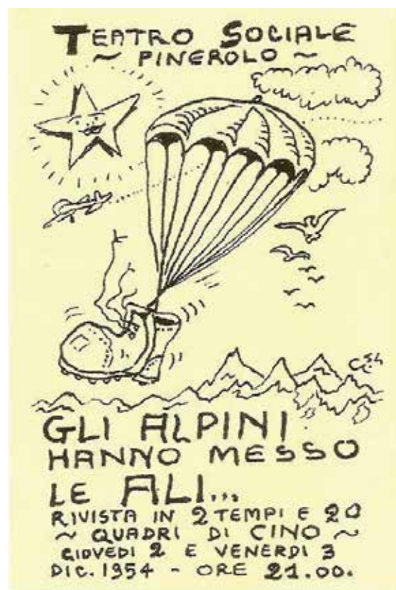
La locandina della rivista