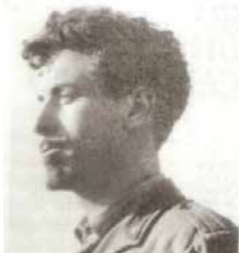
Lalpino Cino Tortorella

Il giorno 22 marzo 2017, all'età di 89 anni, è deceduto a Milano Federico Tortorella, noto come Cino. Nato a Ventimiglia nel 1927 fu un conosciuto programmatore della televisione. Va ricordato in particolare nel mondo dei bambini in quanto impersonò e diresse dal 1959 al 2007 la figura di "mago Zurli"